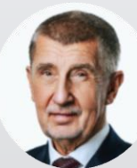
Ing. Andrej Babiš předseda, Úřad vlády České republiky