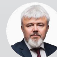
Pavel Štefka náměstek hejtmana pro zdravotnictví Pardubický kraj