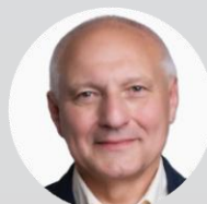
Ing. Zbyněk Pražák, Ph.D. náměstek primátora, Statutární město Ostrava