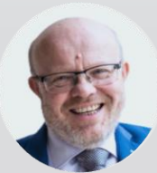
prof. MUDr. Vlastimil Válek, CSc., MBA, EBIR místopředseda - Výbor pro zdravotnictví, Poslanecká sněmovna Parlamentu České republiky