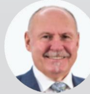
Ladislav Okleštěk hejtman, Olomoucký kraj