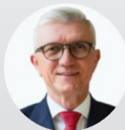
Mgr. Zdeněk Zajíček prezident, Hospodářská komora České republiky