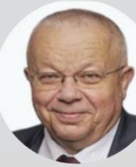
MUDr. Jiří Mašek předseda Výboru pro zdravotnictví, Poslanecká sněmovna Parlamentu České republiky