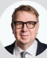
Ing. Aleš Juchelka ministr, Ministerstvo práce a sociálních věcí České republiky