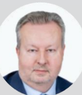
Mgr. Richard Brabec hejtman, Ústecký kraj